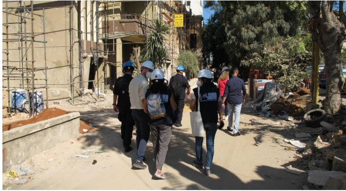
Un momento della missione ricognitiva della Task Force Unite4Heritage a Beirut

A seguito della disastrosa esplosione che ha duramente colpito la città di Beirut, il 4 agosto del 2020, causando più di 200 morti e immense distruzioni nel tessuto urbano, sociale e culturale della città, si è attivata una viva risposta per conto degli Istituti preposti alla salvaguardia del Patrimonio Culturale, anche a livello internazionale. In questo contesto di