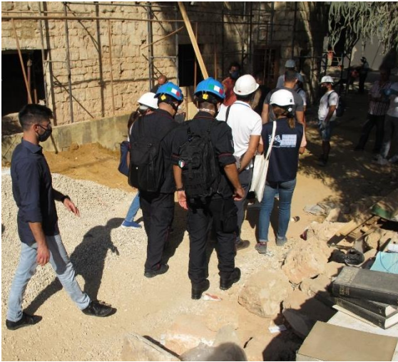
La Task Force Unite4Heritage a Beirut durante i sopralluoghi